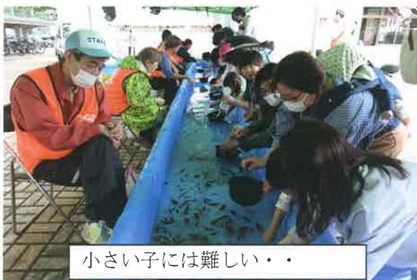
小さい子には難しい・・・

昭和40年に、青少年の非行の防止を目的に発足し、現在では青少年の育成に取り組んでいる団体です。鶴岡市青少年育成推進員45名で構成されています。 いろいろ行われている育成のイベントに協力をしていますが、鶴岡市子どもまつりでは、当会の会長が実行委員長を務めています。また金魚すくい「金魚ゲットだぜ」で出店し、遊びを通して子どもたちの成長や親子の豊かな関係づくりを進めたいと思っております。