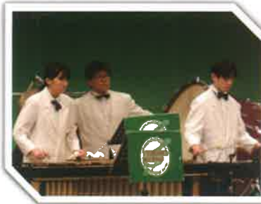
鶴岡東高等学校 吹奏楽部